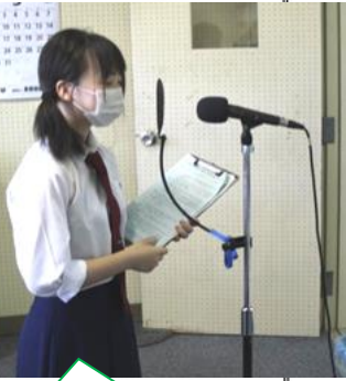
両日とも分散登校で1/2が出席の教室への放送で実施。重要案件は投票を行った。