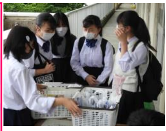
ゴール者全員に賞品進呈 熊西グッズも賞品となった