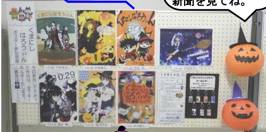
ポスターには七作品が応募とと共に校内五ヶ所に掲示している

今回、競技参加はHR単位ですが、 最終順位は団(カラーチーム)ごとに決まります。