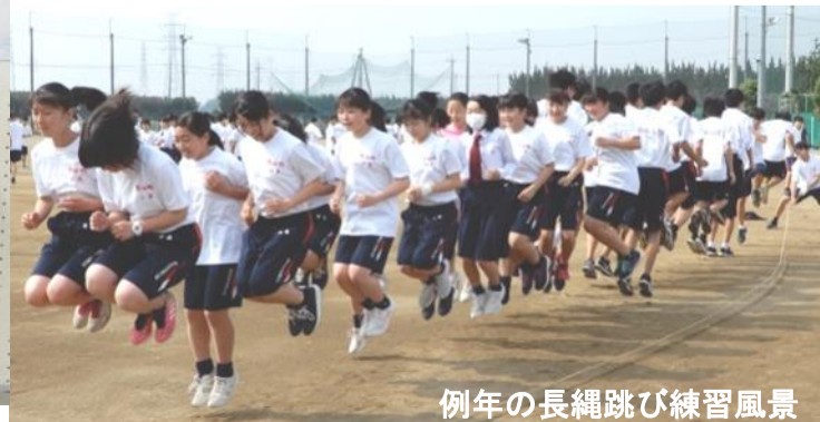
例年の長縄跳び練習風景

14:20~ 14:35 閉会式 司会(放送部) * 各時間はあくまでも予定です 校長先生講評・成績発表・表彰・諸連絡