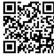
本校ホームページのQRコード