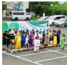
西高祭 全員で作り上げるクラス劇