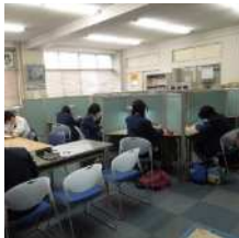
自習室での自学自習に励みます