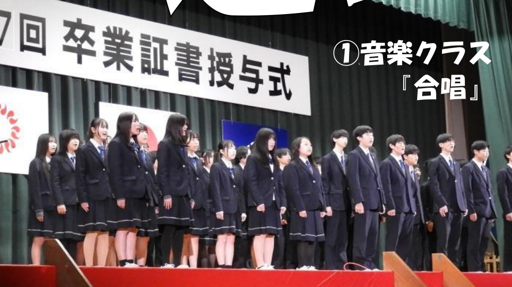
7回 卒業証書授与式 ①音楽クラス「合唱」