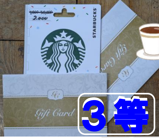
スタバのギフトカード×3本