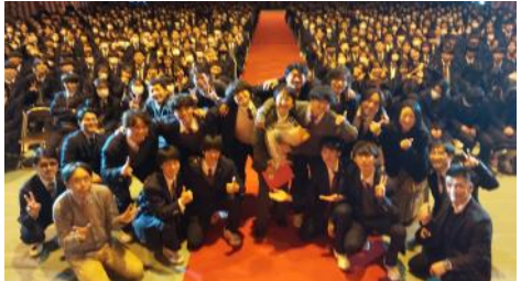
④生徒会執行部のプレゼント企画「ダーツdeポン！」