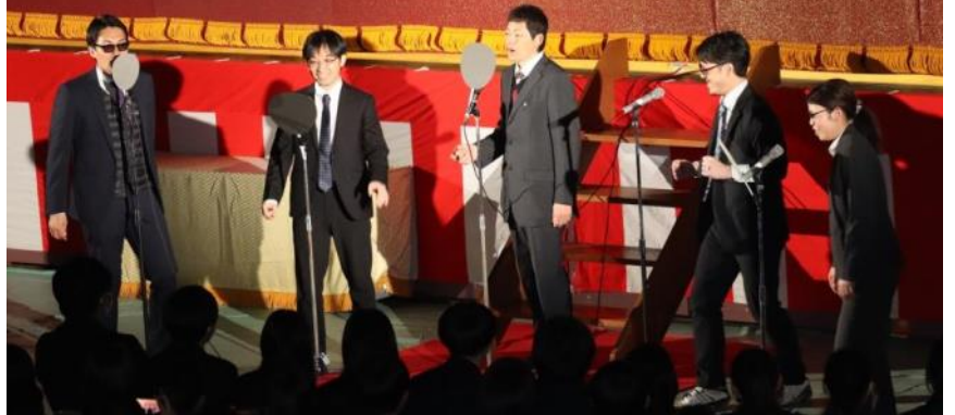
②3学年の先生方の出し物