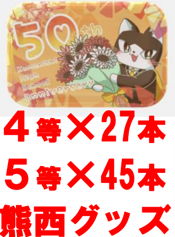
4等×27本 5等×45本 熊西グッズ