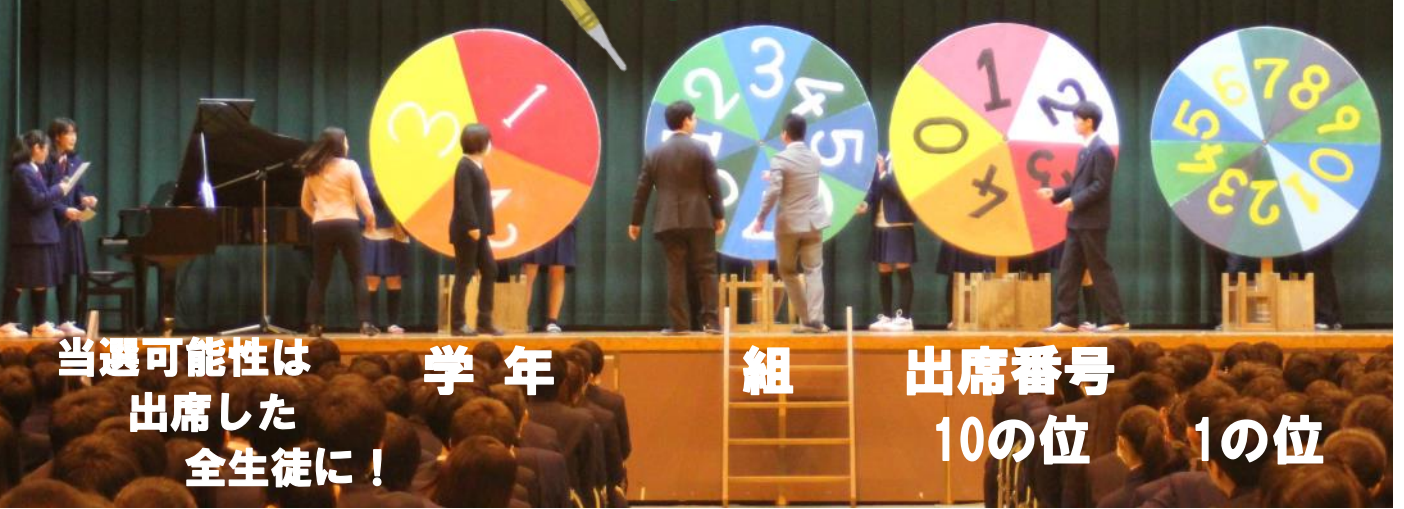
当選可能性は 学年 組 出席番号 全生徒に! 10の位 1の位