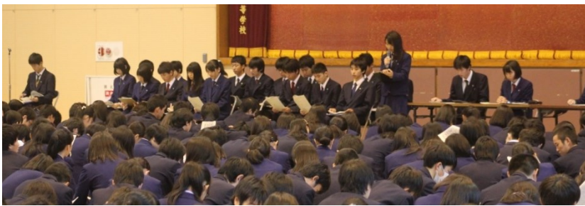
生徒総会後 西高祭スライド上映 (前期行事総括として)

西高祭決算表を見て、まず目につくのは特活対応の額の大きさだ。これはいわゆる「業者」さんに支払う予算部門だ。他校では全く見られない花火・サブステージ・PA(音響)に四十八万円近くを使っている。花火はOBの先輩が破格の安値でやってくださっているからいいとしても、サブステージ・PA(音響)の額はあまりに大きく、パンフレット印刷代を軽く上回る。生徒自身が作り上げる西高祭の中で、大予算の「業者」さんの用意する舞台や音響は似つかわしいとは思えない。西高祭はそんなレベルではないだろうと考える。校門