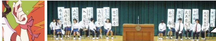
9月27日 立会演説会より 立候補者の名前垂幕は、恒例 書道部の協力。

副会長と言えれば来年度の西高祭では、細かなイベントを企画提案する立場ともなる。「来年度の西高祭もリボン交換の相手がいかなかったらどうしよう(汗)」とおどけつつも、もはや彼の頭の中には第四十二回の西高祭が存在している。彼の繰り出す新たなイベント企画が楽しみである。