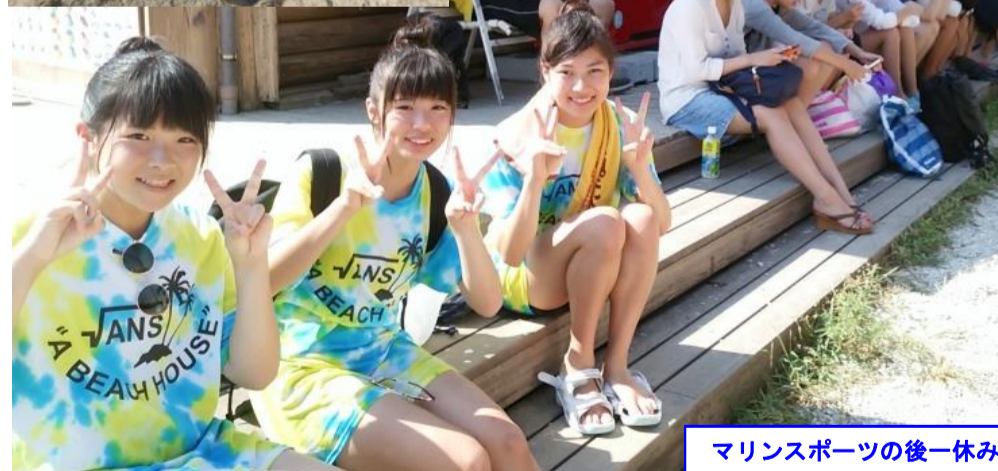
マリンスポーツの後一休み