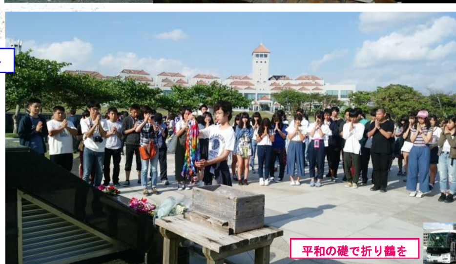
平和の礎で折り鶴を