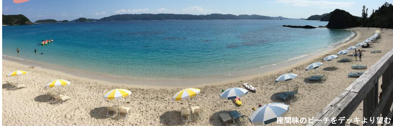
座間味のビーチをデッキより望む