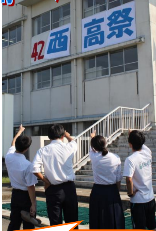
クイズです。「西高祭」の垂れ幕の布、元は何の商品だったのでしょうか？

「あ、ウチのクラスの旗だ。懐かしい！」と歓声が上がリ、記念写真を撮る姿も見られた。設置は生徒会執行部。西高祭の垂れ幕とともに校外にもアピールするために例年掲げられる。四十枚の旗が風にたなびく姿は圧巻だ。ペンキで描かれた絵は「アメニモマケズ」でもある。