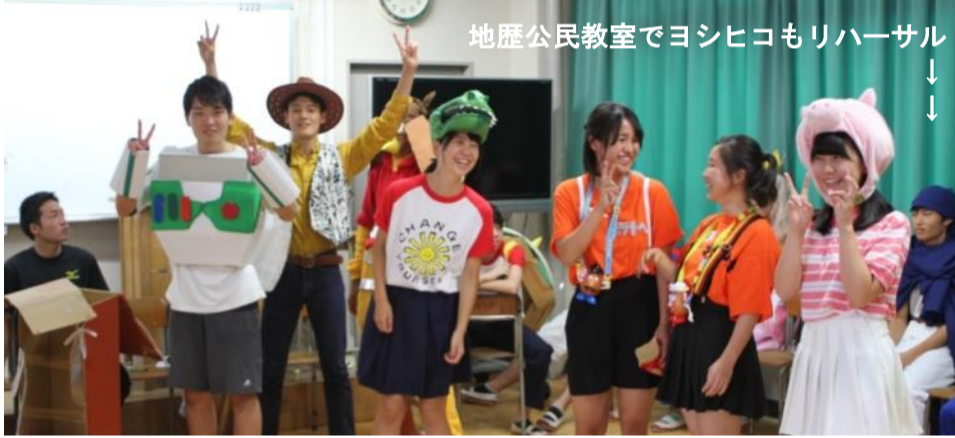
地歴公民教室でヨシヒコモリハサール