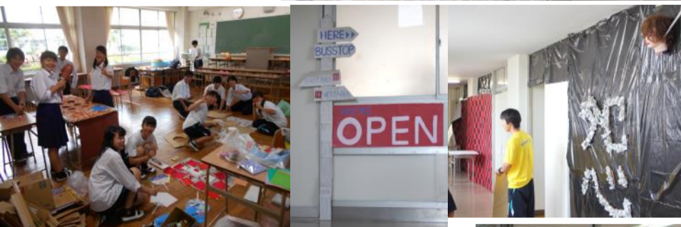
8月26日(土) 27(日) も多くの生徒が登校