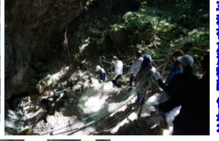
ガマ体験とゆづりの塔 平和祈念資料館 伊是名島