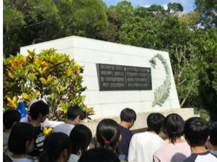
二日目【五日(日)】 ガマ体験とゆづりの塔 平和祈念資料館 伊是名島