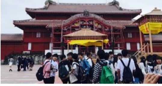
一日目【四日(土)】 守礼の門 首里城