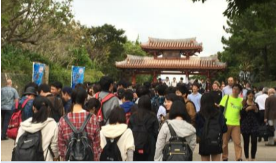
一日目【四日(土)】 守礼の門 首里城