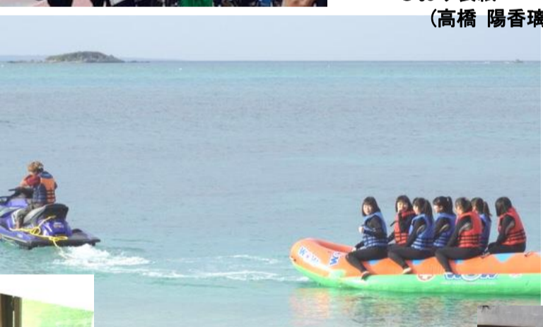
三日目【六日(月)】 マリン体験 家業体験 他