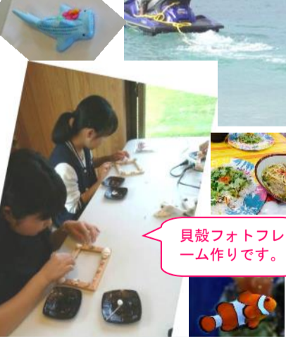
貝殻フォトフレーム作りです。