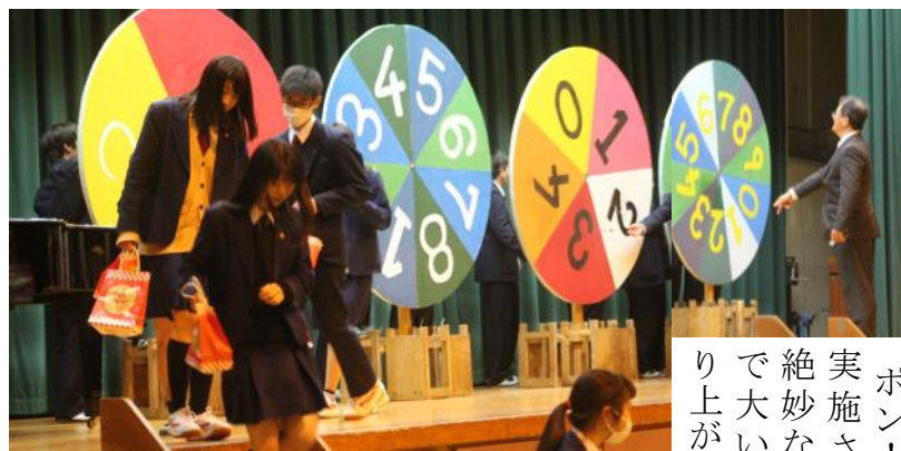
直径180cmのまとは生徒会執行部が作成 ダーツの矢は三学年の先生方が投げた

卒業式の前日三月十二日(月)卒業式の予行・美術部壮行会に続いて、三年生を送る会が行われた。二年生音楽選択クラスの合唱二曲・三年年の先生方作成の三年間の思い出スライドショー・出席番号で当選するプレゼント企画『ダーツポン!』が実施され、絶妙な司会で大いに盛り上がった。