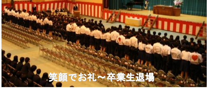
笑顔でお礼～卒業生退場