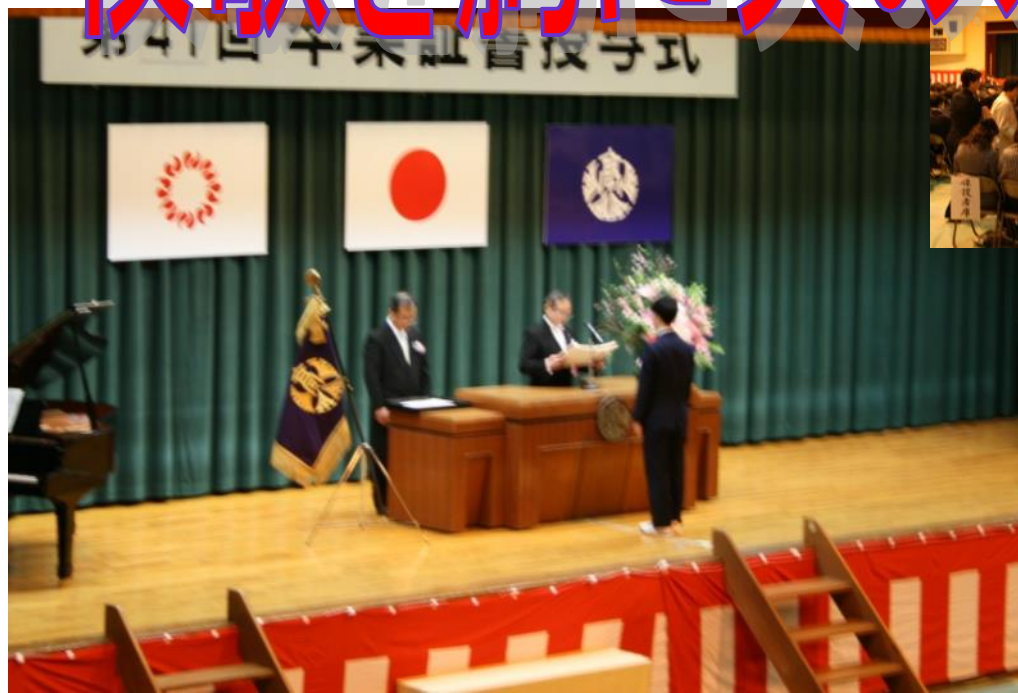
普通科・理数科代表生徒がそれぞれ卒業証書を校長先生より受け取る