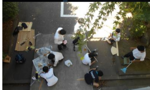
校内で下書き⇒ペンキ着色は外でがルール。日陰を利用。