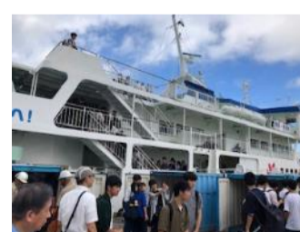
フェリーで渡嘉敷島へ (1時間10分)