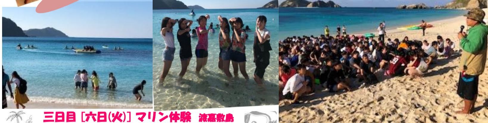
三日目 [六日(火)] マリン体験 渡嘉敷島

発行所 埼玉県熊谷市三ヶ尻2066番地 埼玉県立熊谷西高等学校 編集・発行・印刷 熊谷西高等学校 特活部・生徒会