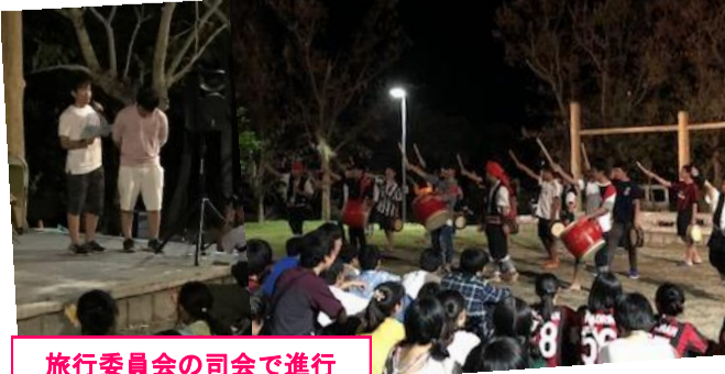
旅行委員会の司会で進行