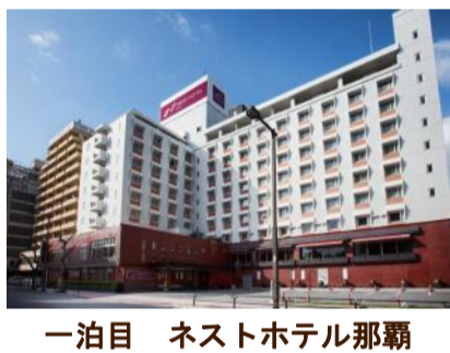
一泊目 ネストホテル那覇