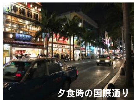
夕食時の国際通り