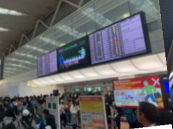
羽田空港の水関係トラブルニモマケズ集合～出発！